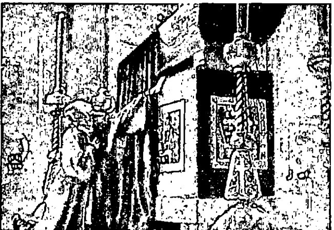
• IVAN LE TERRIBLE • : SEQUENCE DES FUNERAILLES D'ANASTASIA.